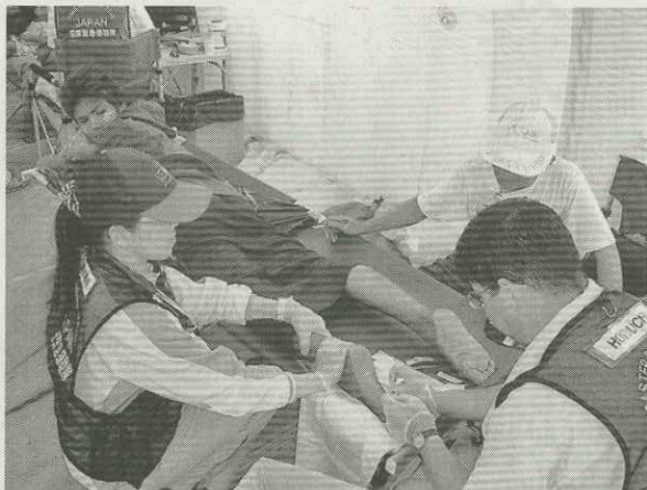
20年6月のミャンマーサイクロン支援での国際緊急援助隊医療チームとしての活動。左端が筆者

事者が希望すれば、柔軟に利用できる医学図書館の開放が、今後必要になってくると思います。